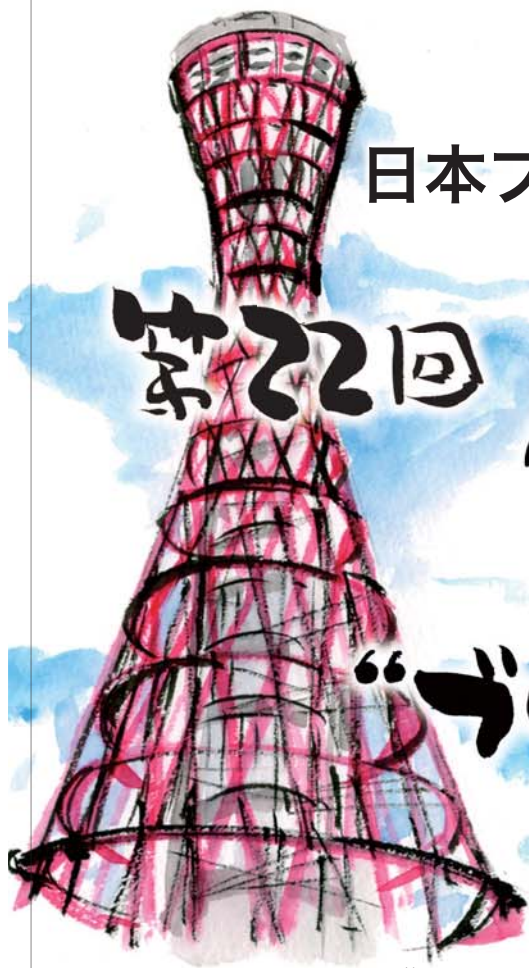
神戸ポートタワー